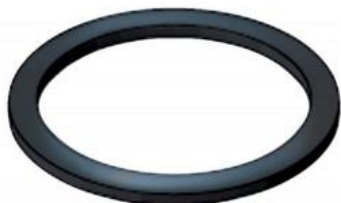
EMPAQUE DE BUNA