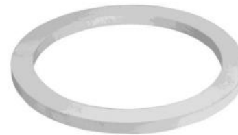
EMPAQUE DE NEOPRENO BLANCO